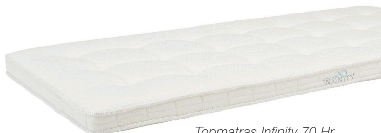
Topmatras Infinity 70 Hr