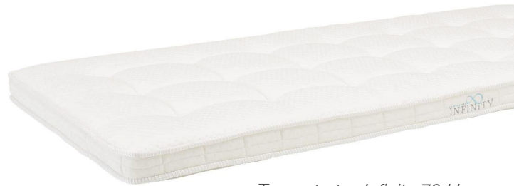
Topmatratze Infinity 70 Hr