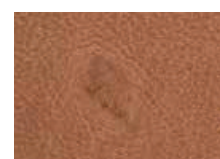
Narbe offene Wunde