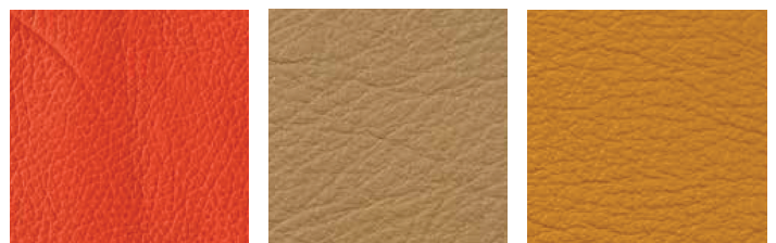
Strukturen von Masterleder